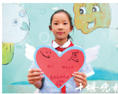
茅箭区西坪小学 万菲杨 11岁

有次下大雨,代先超没带伞,他联系不上爸爸,只好淋着大雨回家。“我想要一块电话手表,可以在突发情况下联系爸爸。”代先超说。