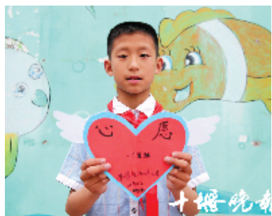
茅箭区西坪小学 张帅恒 10岁

蔡惟波有3个姐姐,父母两个人挣钱供养4个孩子上学,负担有些重。家里的玩具一直是4个人玩,喜欢玩具积木的他不好意思开口让父母买。他说:“我就想要一套玩具积木,想要个我自己喜欢的玩具。”