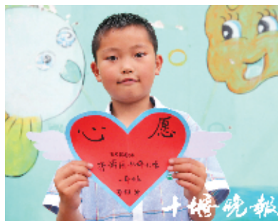
茅箭区西坪小学 蔡惟波 7岁

学习成绩优异的沈佳琪很少让父母操心。她说:“爸爸妈妈工作很辛苦,只有好好学习才能让他们省心。”一年前,老师奖励沈佳琪一套文具用品,如今已经磨损严重,家庭条件不好,父母很难满足她的愿望。沈佳琪说:“我想要一套粉红色的文具用品,因为我喜欢粉红色。”