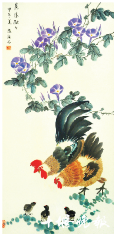
《其乐融融》赵端芬 作

老人们一起交流书画创作心得,挥毫泼墨,创作了不少书画作品,通过书画作品展示了他们的艺术功底,也展现了老人们的精神风貌。既学到了书法知识,同时也丰富了他们的老年生活。