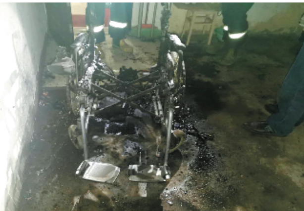
充电起火被烧毁的电动轮椅。