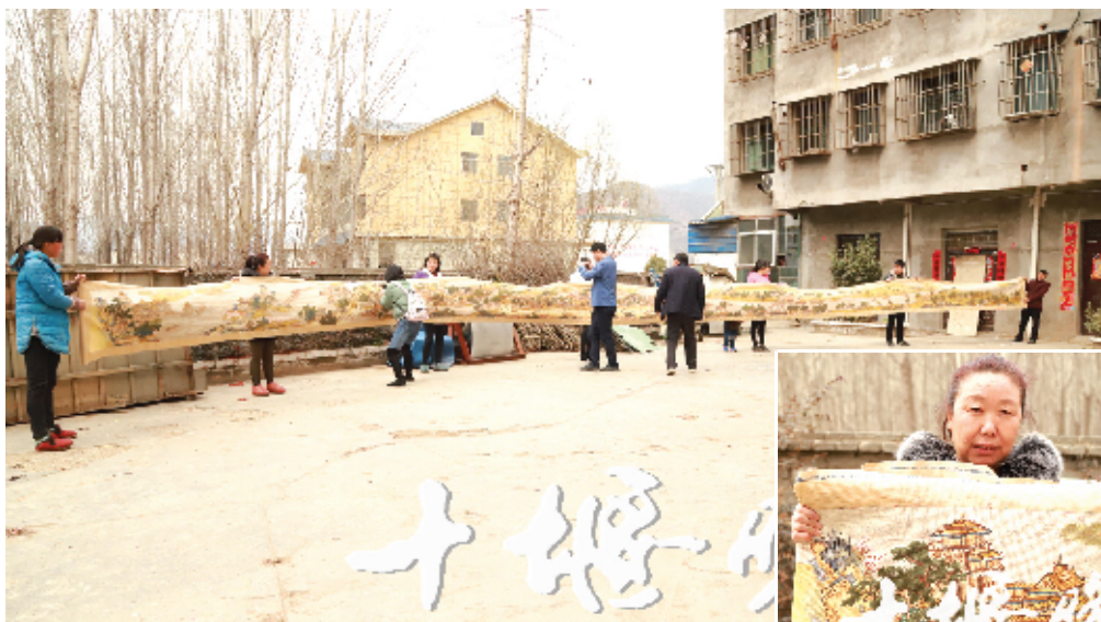
多人合力打开长达22米的《清明上河图》十字绣。