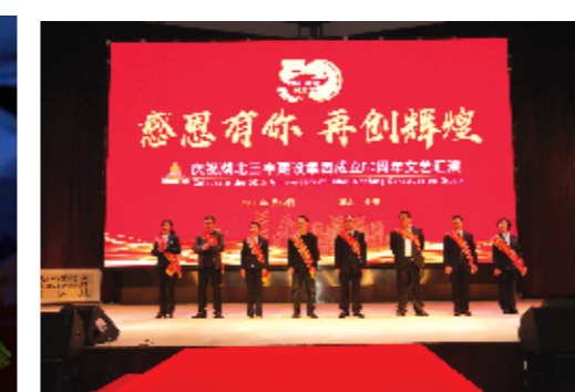
表彰“感动三丰人物”。