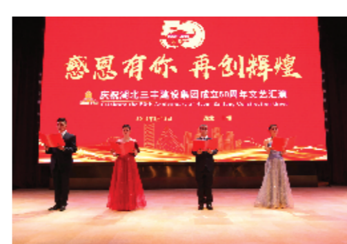
诗词朗诵《致敬三丰》。