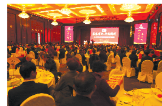
三丰建设集团成立50周年座谈会。

为了还清贷款，公司不得不出售老办公楼，几十人搬进了不足100平方米的门面办公，财务部更是挤在不到6平方米的卫生室办公。艰苦创业之际，每一个三丰人没有任何怨言，最终