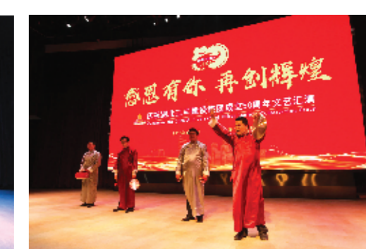
文艺演出三句半《三丰颂》。