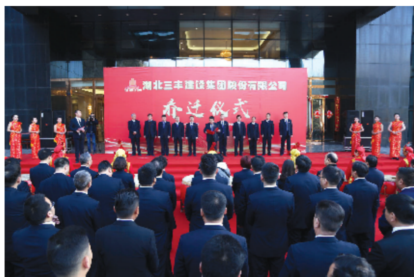
三丰建设集团乔迁仪式现场。