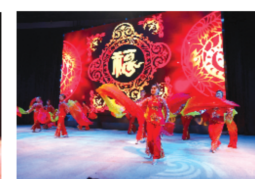
文艺演出舞蹈《欢聚一堂》。