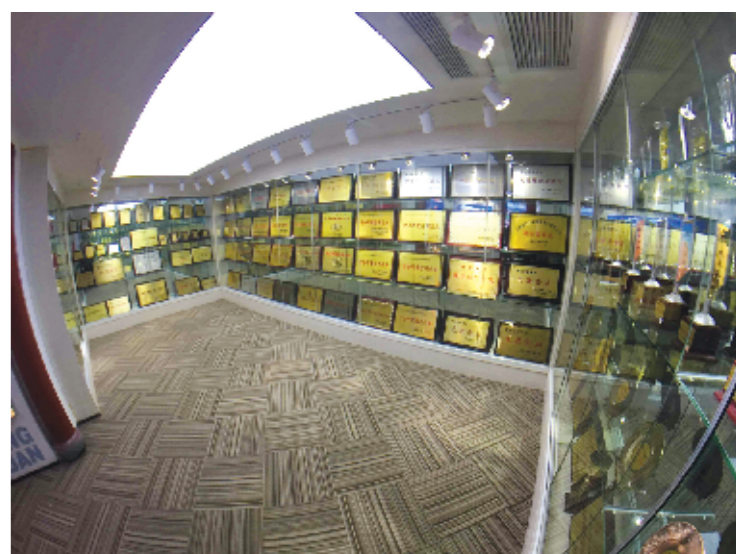
企业文化荣誉展厅。

《道德经》云：“道生一，一生二，二生三，三生万物。”《广韵》载：“丰，茂也，盛也。”“三生万物”之“三”，“茂也盛也”之“丰”，这可以说是对“三丰”一词的最好诠释！