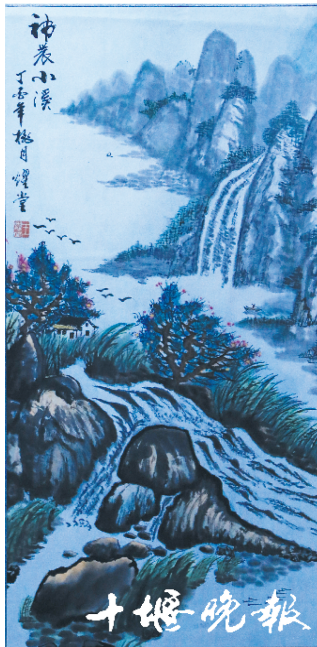
《神农小溪》王耀堂 作