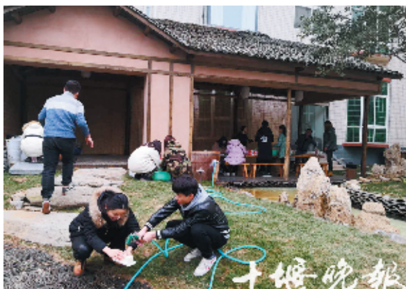
心湖民宿过大年。