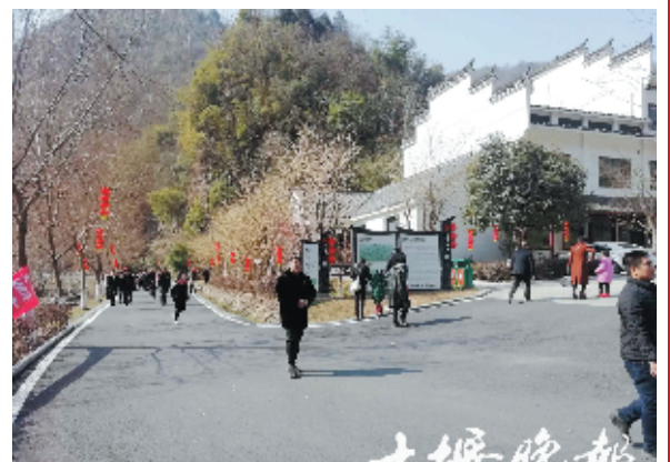
太和梅花谷。