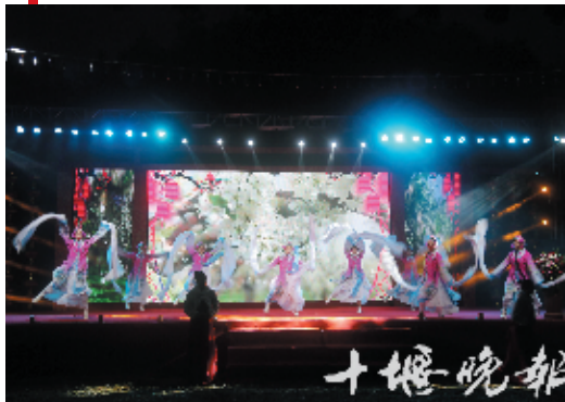
郧阳区民俗文化节。