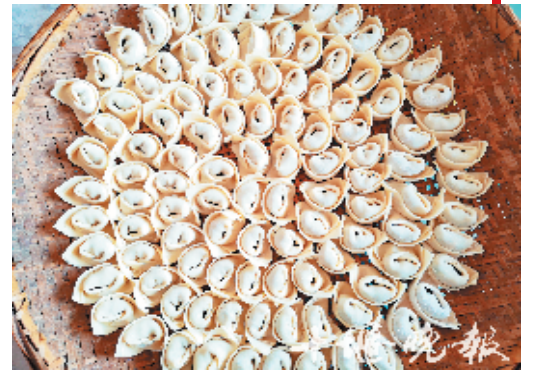
饺子是过年必吃的食物。