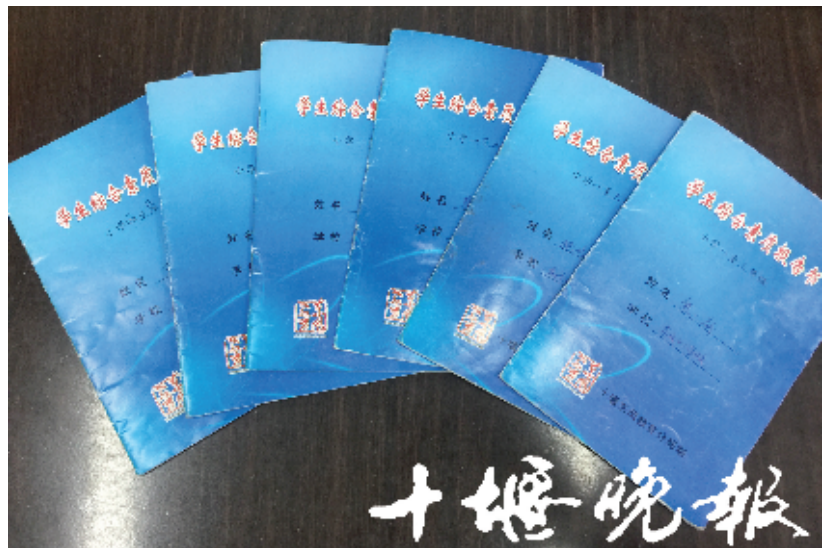
东风41学校提倡老师们在综合素质评价报告书上,给学生们留下新颖而走心的评语。