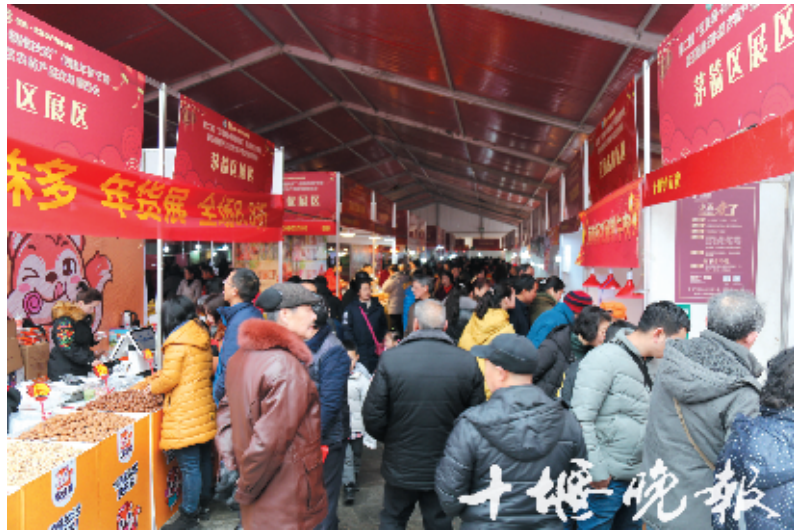
市民涌入农博会现场打年货。