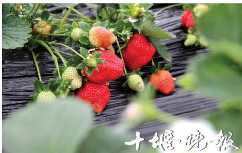
草莓采摘(资料图片)。

推荐地:黄龙镇鲍湾村、柳陂镇月亮湖生态农业观光园、青曲镇伟超生态家庭农场、柳陂镇卧龙岗草莓园、观音镇天河口青科观光园