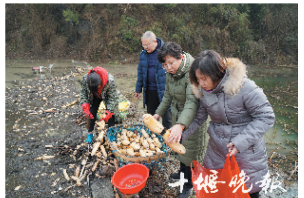
下营村的莲藕吸引了十堰城区的买家现场采购。