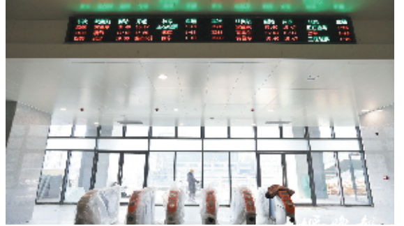
技术人员对电子屏幕等设备进行调试。