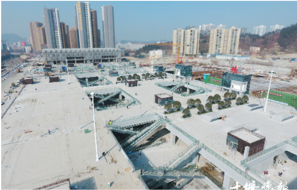
火车站北广场分为地上、地下两个部分,多部电梯连接地下两层。