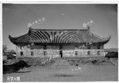
郧阳府学宫大成殿(资料图片)。

“一方面,乾隆皇帝重视教育;另一方面,郧阳府辖区考风比较好。”档案专家分析认为,总体来说,郧阳府辖区整体考风还是很不错的。