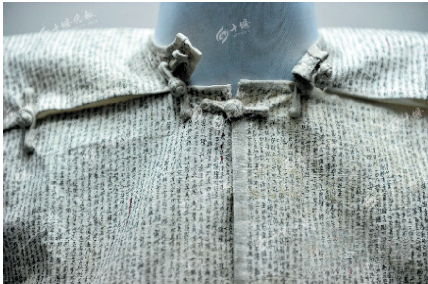
科举考试时考生作弊用的坎肩(资料图片)。