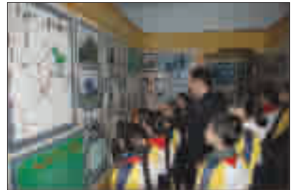
草店小学宣传十八大精神,开展革命好传统教育。

景区办事处积极引导景区群众树立“人人都是景区形象,事事关乎景区发展”的意识,增强景区广大村民文明意识,自觉保护生态环境。继续擦亮小红帽品牌,