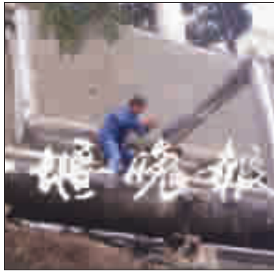
工作人员开阀送汽。

昨日一早,接到美林香榭小区物业反映小区内网漏水后,东风公司热电厂工作人员立即赶到位于朝阳路果品巷 10 号的美林香榭小区。在现场看到,经热交换站通往小区 1 号楼的一根管道“哗哗”漏水。该小区是新建小区,今年是第一次用暖。工作人员分析可能是这根管道的阀门垫片出现问题。经维修,一小时后管道恢复正常。随后,工作人员打开小区主阀门,蒸汽通过管道传输至热交换站,再经小区内网到达业主家中。正