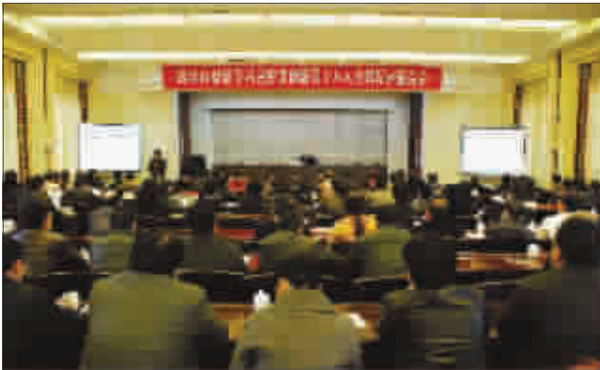
武当山特区学习贯彻落实十八大精神报告会。

丰富活动拓思路。十八大提出大力推进生态文明建设,努力建设美丽中国。特区以全省开展的“万名干部进万村洁万家”活动为契机,开展了环境整治工程。同时在新“三万”活动中,要求党员干部要提高宣讲的针对性和实效性,贴近群众,符合基层实际。特区纪检监察系统开展纪检干部民主讨论会和廉政文化教育等活动;特区组织部结合十八大精神,围绕基层党组织建设、人才特区建设、党员干部教育管理、干部选拔监督、干部人事制度改革等方面深入开展讨论,创新工作方式和工作方法;特区教育系统开展学习贯彻十八大精神暨师德师风建设工程宣誓,宣传