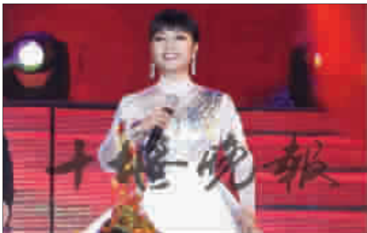
殷秀梅倾情演唱《中华回声》。