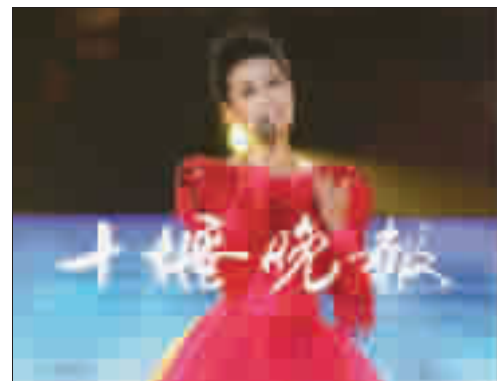
谭晶演唱《最甜最美汉江水》。