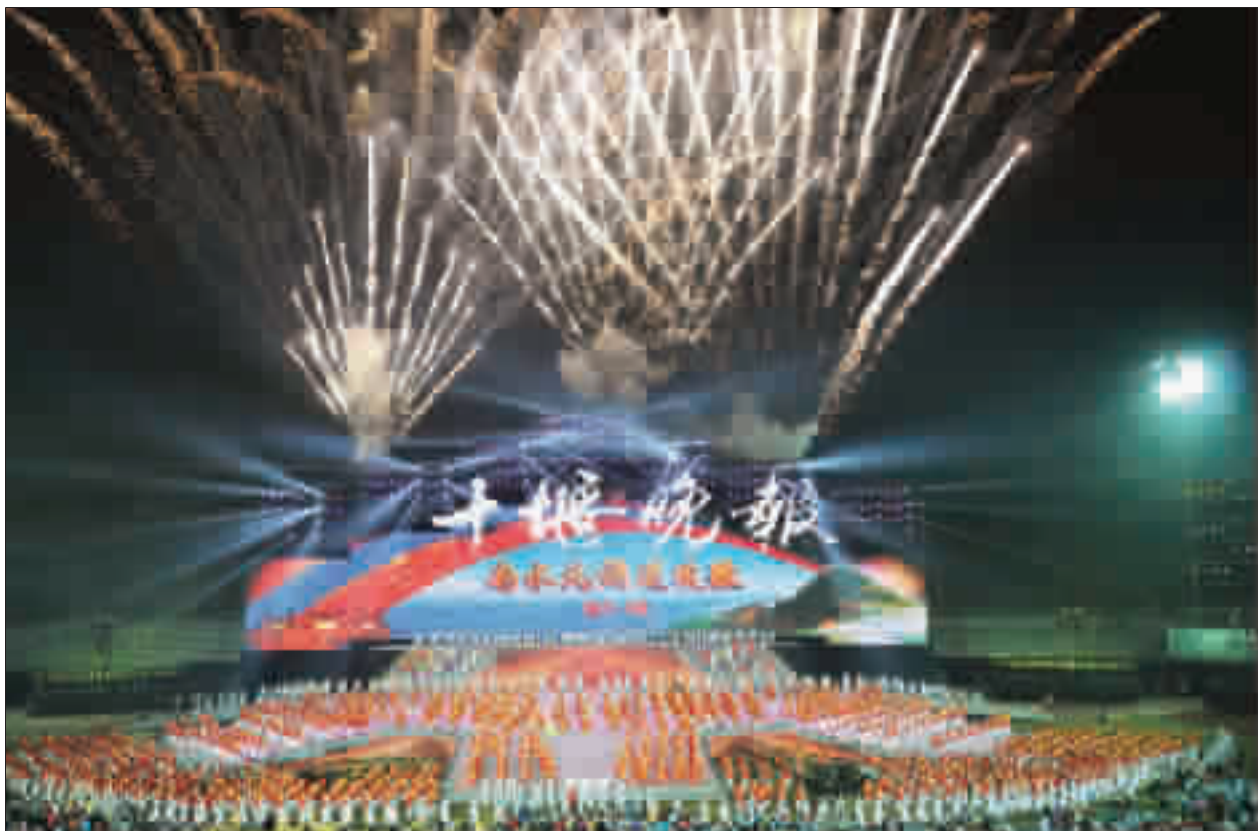
聆听着南水北调欢歌而来的足音,把幸福的歌唱给党。