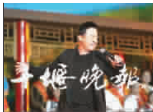
汪正正演唱《再唱山歌给党听》。