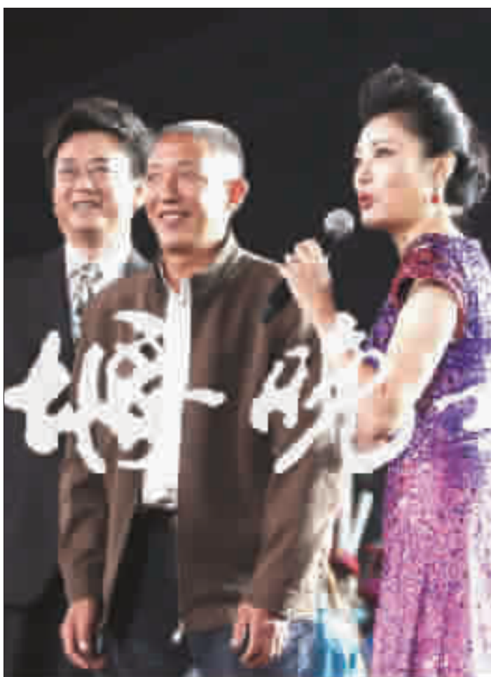
央视主持朱军、周涛现场采访移民代表。