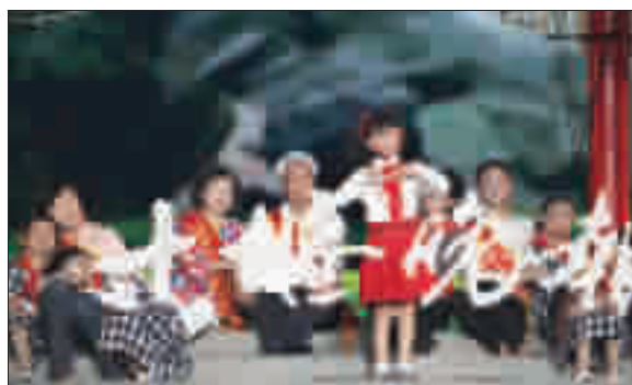
移民代表参与演出。