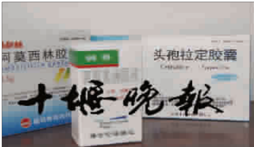
无需处方,就能在药店买到阿莫西林等抗生素药物。

同小异,面对要购买《办法》明确限制的抗菌药物,所有药店均没有向记者索要处方。其中有些药店明确表示购买抗生素类药品不需要处方。