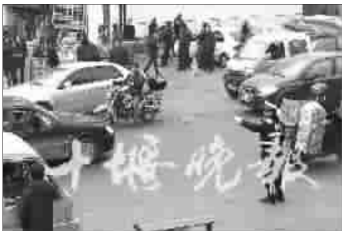
在城区堵车严重路段,交警部门增派警力加班加点疏堵。

先。他认为,城区拥堵日盛,归根结底是车辆增速太快,私家车猛增,致使公共交通不便所致。一是在城区开辟公交专用通道。公交车型庞大,行动比较迟缓,一旦堵车,公交难以动弹,继而导致整条道路瘫痪。二是实现公交微循环。目前,我市公交多