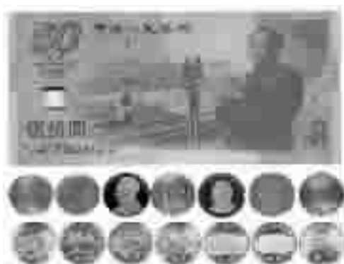
全套包含毛泽东、邓小平、周恩来、刘少奇、陈云、朱德、宋庆龄七大

伟人头像纪念币和我国首枚伟人纪念钞,6枚毛主席伟人勋章,真钞实币,确保超高收藏价值。我市配额仅120套。