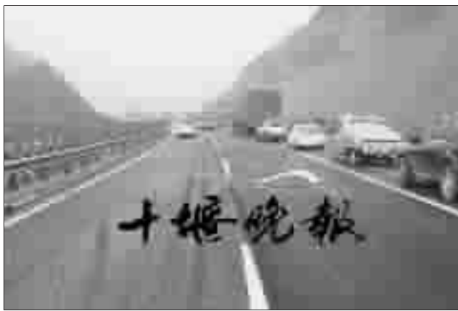
高速公路结冰,不时引发交通事故。

能见度低,加上温度低,路面容易结冰,高速民警建议尽量避开这段时间出行。出行前,最好拨打电话咨询,全省高速公路24小时路况