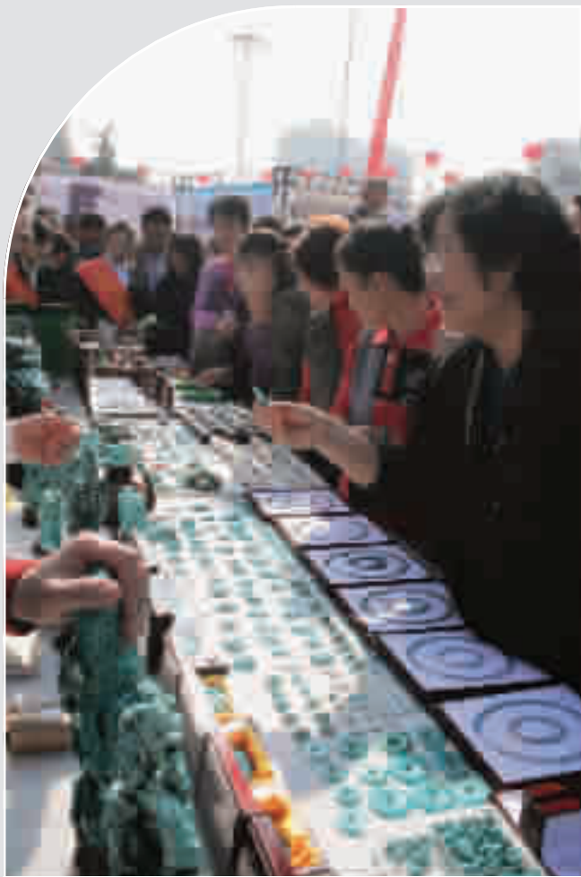
琳琅满目的绿松石饰品。