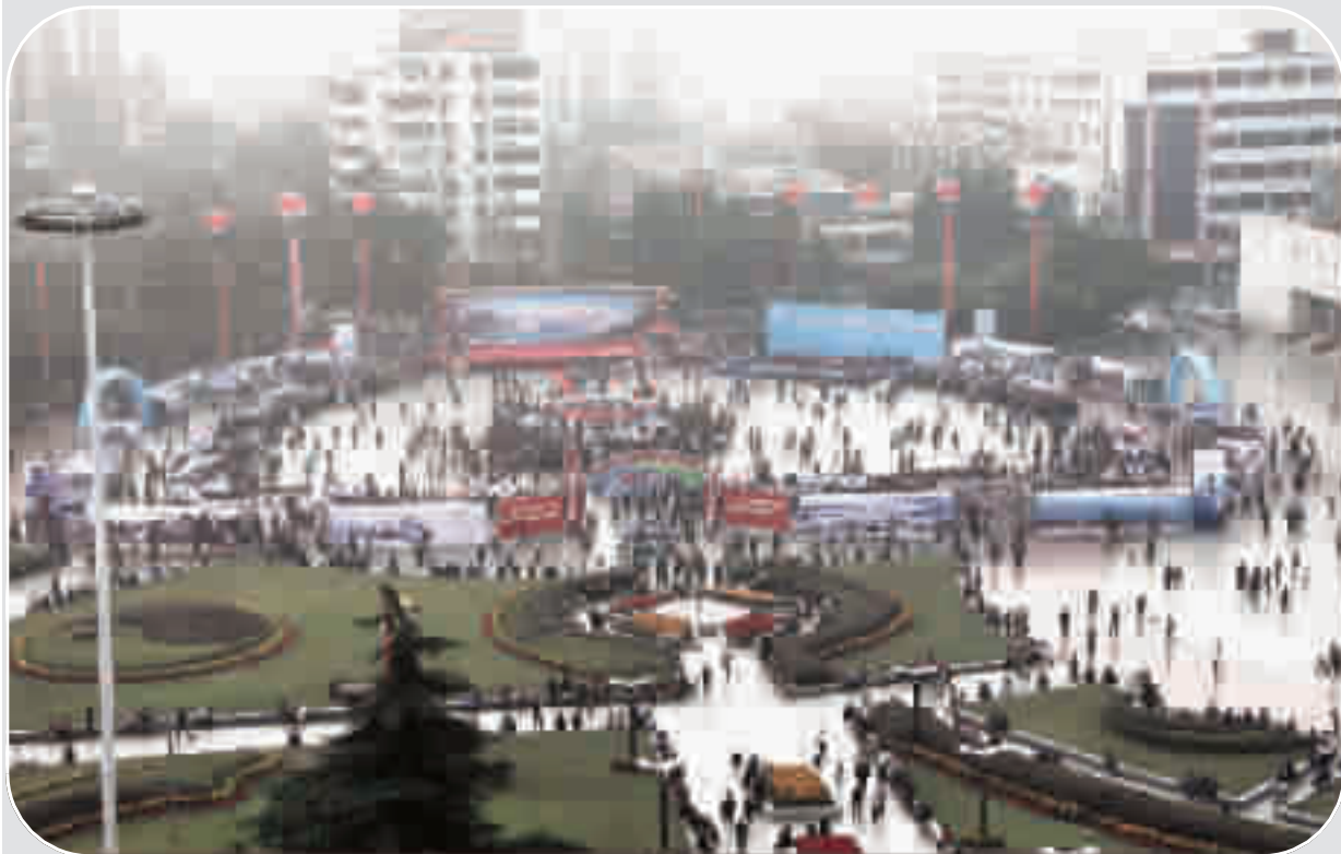
第九届武当国际旅游节现场。