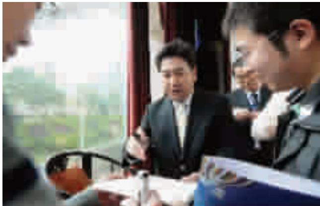
活动结束后,水均益接受本报采访,并给本报读者留言。

十堰市民熟知水均益,很大程度上来自于他所主持的专访节目,特别是专访国际风云人物。到目前为止,水均益已经成功地做过200多次重要专访,专访对象包括前任联合国秘书长安南和加利、俄罗斯前总统普京、英国前首相布莱尔、法国前总统希拉克、美国前总统卡特和克林顿、美国前国务卿基辛格和鲍威尔、加拿大前总理克雷蒂安、德国前总理施罗德和施密特、意大利前总理普罗迪、西班牙首相萨帕特罗、欧盟委员会主席巴罗佐等。人们这样评价他:他