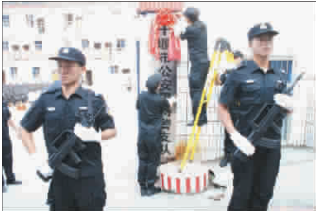
昨日上午9时,市公安局特警支队授牌仪式在十堰市警官培训学校举行。