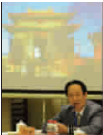
阎崇年出席故宫·武当山(明代)紫禁城文化研讨会。