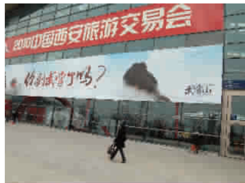
武当山巨幅宣传海报。