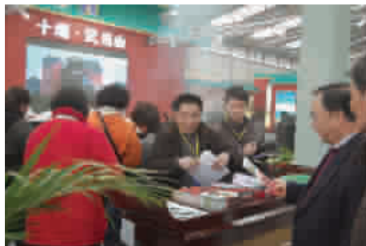
十堰展台前人头攒动。