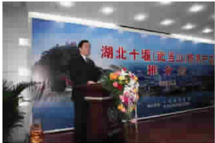
推介会上,十堰市旅游局局长卢熹昌介绍十堰旅游产品。