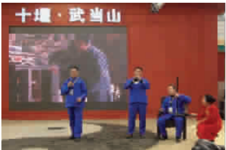
吕家河民歌村的歌手演唱《对门黄草坡》。