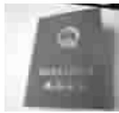
乾慷男科成果证书

救治的患者遍布三十个省、市、自治区。国家卫生部《健康报》、《中国初级卫生保健》等报刊,多次推介。