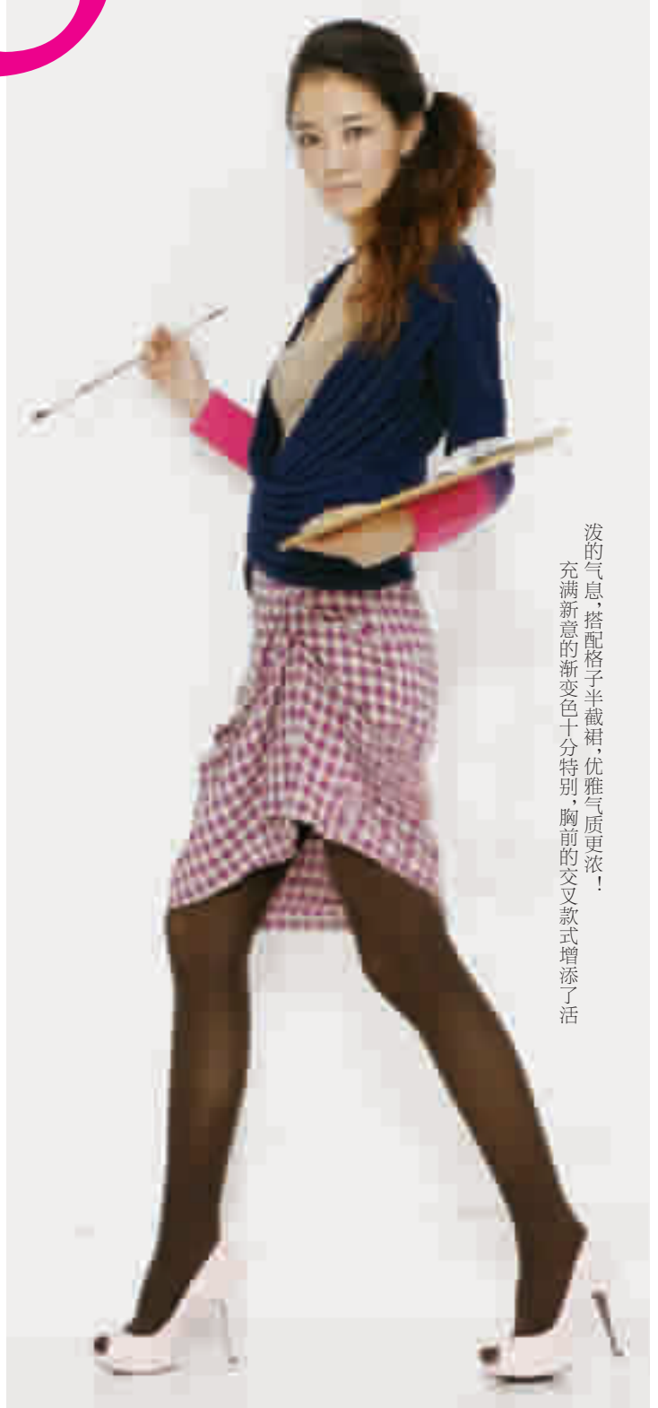
泼的气息,搭配格子半截裙,优雅气质更浓! 充满新意的渐变色十分特别,胸前的交叉款式增添了活