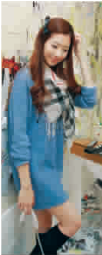
天蓝色竖条纹编织长衫清新水嫩,让你看起来更加清纯可爱,搭配格子围巾,增添亮点!

经过一个夏天,囤了好多背心和挂饰,马上就要穿上厚厚的“熊猫装”了,怎么办?在这个即将进入深秋的季节,用百搭毛衣帮你解决难题,无论是毛衣内搭彩色小背心,还是毛衣外加闪亮饰品,总之这个季节,毛衣会让你美丽又出众…… 瑞丽