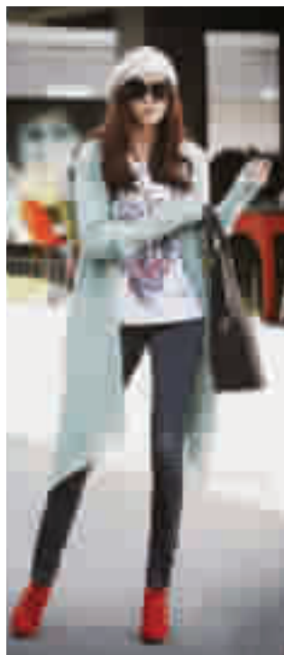
紧身牛仔裤,流露出浓浓的时髦气息! 素雅的青色尽显优雅风范,搭配蓝色