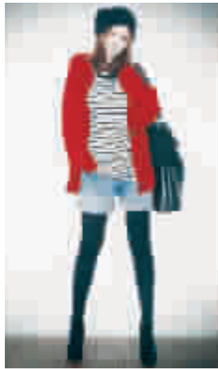
充满层次感! 搭配浅蓝色破洞牛仔短裤,令你的装扮亮丽的红色宽松编织毛衫十分抢眼,