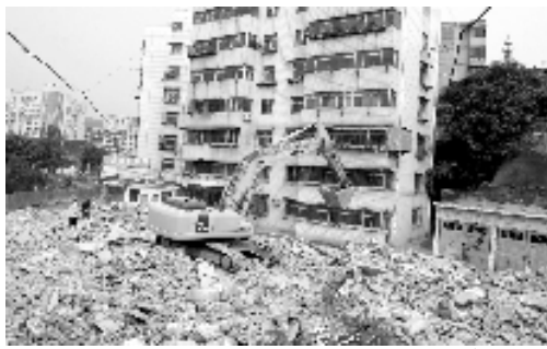
原市财校门口一栋楼房正在拆迁。

站开往五堰、六堰等路段的车辆可以自车站路经北京路南出口上北京路,五堰、六堰等路段开往火车站方向的车辆也可以取道北京路绕开人民路,有效解决车站路交通瓶颈问题,缓解人民路的交通压力。