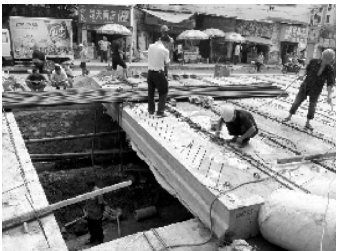
上海路二期开始吊装河道盖板。