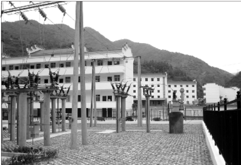
叶大乡新集镇一角。