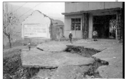
叶大乡中心小学办公楼成为危房。