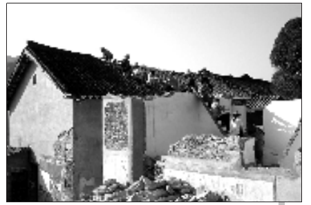
叶大乡群众主动拆除滑坡体内的危房。