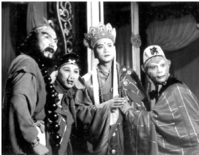
《西游记》中的师徒四人。